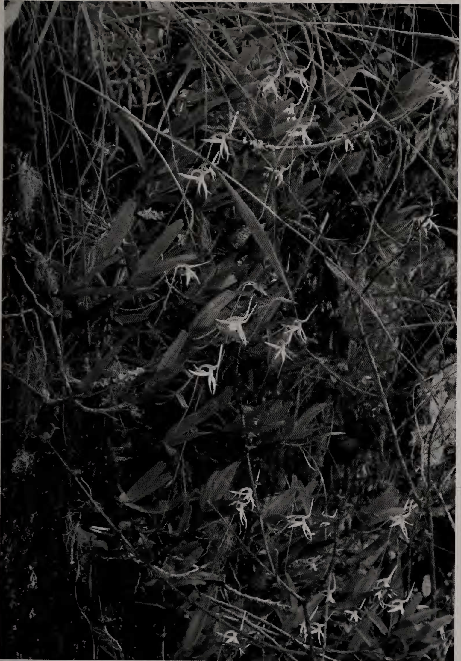
Fig. 2 : Jumellea bernetiana in situ